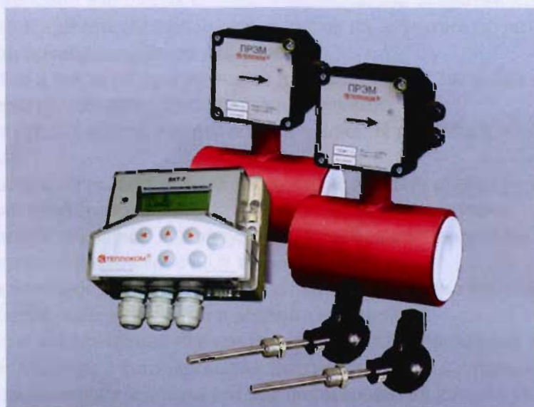
Рисунок 1 – Внешний вид теплосчетчика

Внешний вид теплосчетчика приведен на рисунке 1.