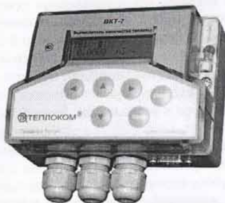
Рисунок 1 – Внешний вид вычислителя

Внешний вид вычислителя приведен на рисунке 1.